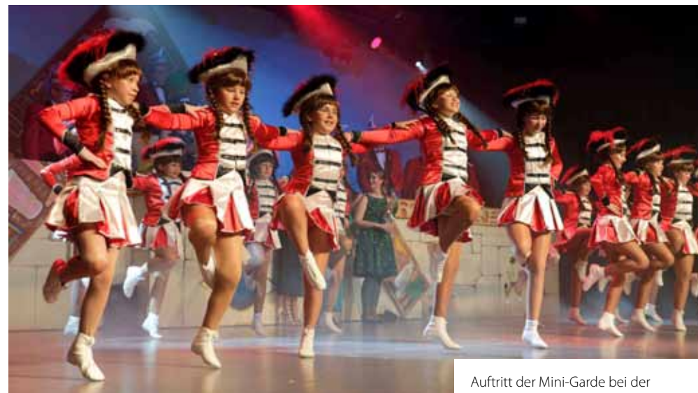
Auftritt der Mini-Garde bei der Kampagne 2018/2019.