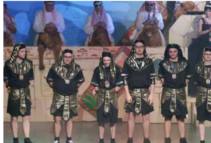
Die Jung-11er im Bühnenoutfit.

Im Sommer führen die „Jung-11er“ gemeinsam mit dem Elferat das traditionelle Grillfest der BiKaGe durch. Auch beim Weihnachtsmarkt ist man aktiv. Wer beim Jung-11er-Rat gerne dabei wäre, kann sich unter Jung-11er-Rat_gruppe@bikage.de melden. Nachwuchs ist gerne gesehen. (tom)