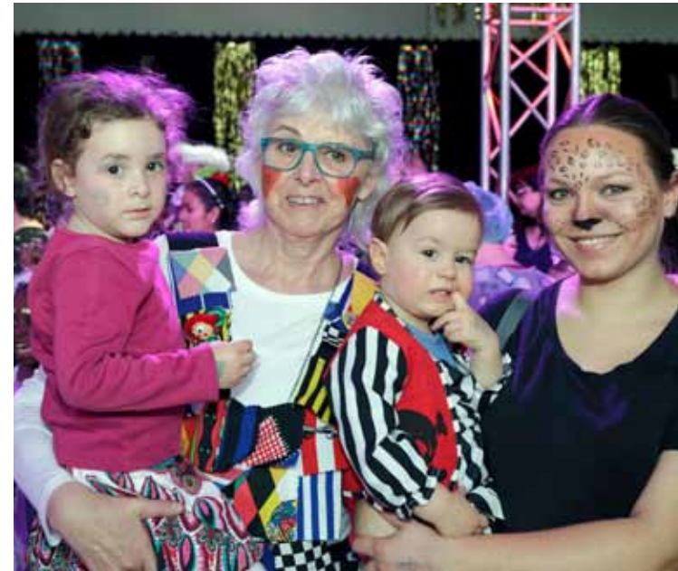
Der JFK organisiert auch den Kinderfasching.

Eine große Herausforderung ist alle zwei Jahre, das Stadtfest in Kandel zu organisieren. Dabei ist man drei Tage mit ungefähr 120 Helfern im Einsatz. Im Späthjahr wird die bei den Vereinsmitgliedern beliebte Herbstwanderung im Pfälzer Wald geplant. (tom)