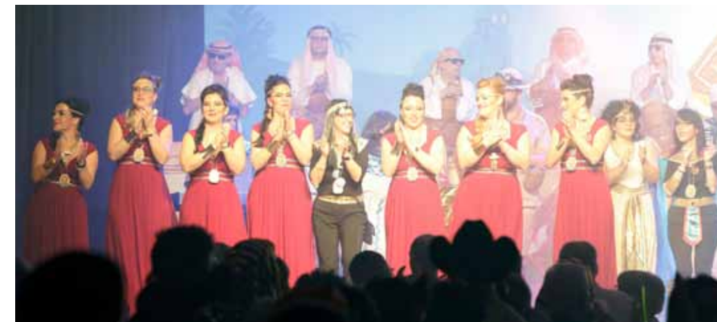
Die Damen der Eskorte.

Für die Auswahl der Kostüme, die in der Regel selbst geschneidert werden, finden rechtzeitig vor der ersten Sitzung Besprechungen statt. Treffen der Eskorte finden auch außerhalb der Kampagne statt. So wird unter anderem im Sommer ein Grillfest veranstaltet. (tom)