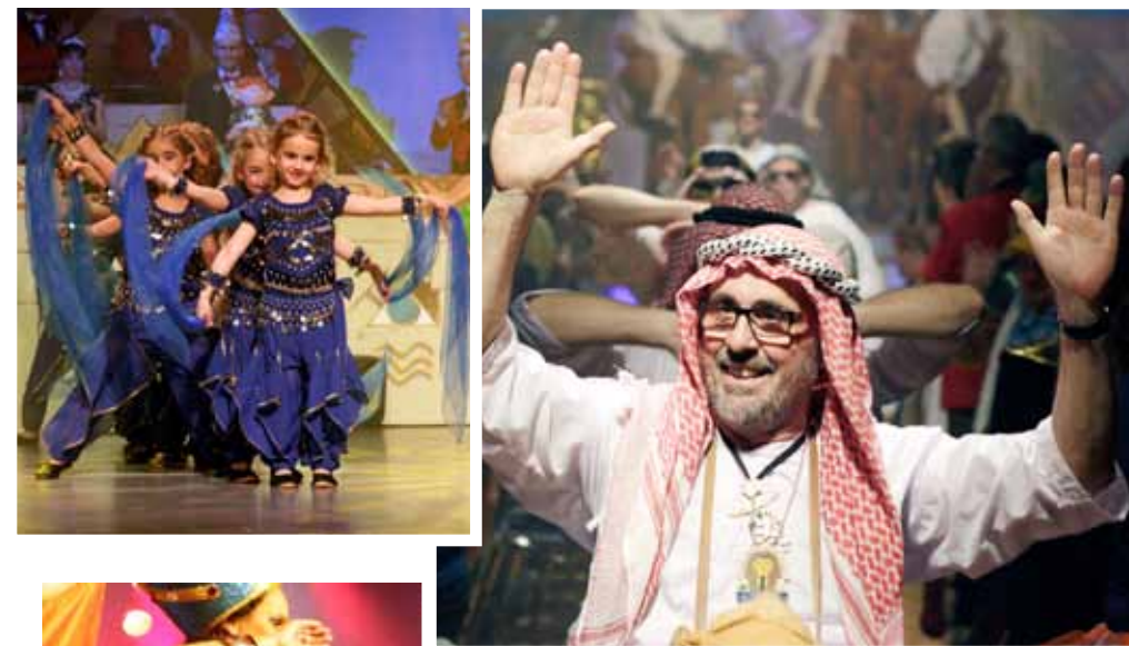
2018/2019 lautete das Motto „Ägypten“.