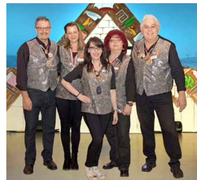
Mit dem Beginn der Prunksitzungen in seinem Element: das BiKa-Team.