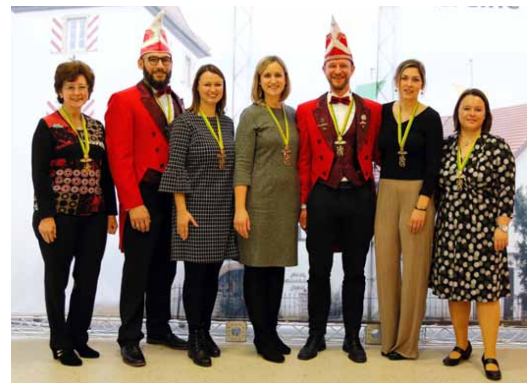
Die diesjährigen Preisträger bei der Verleihung der Goldenen Löwen in Speyer.