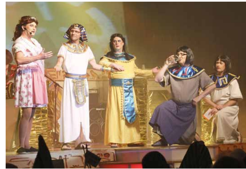
Das Krautkopfteam in Aktion.