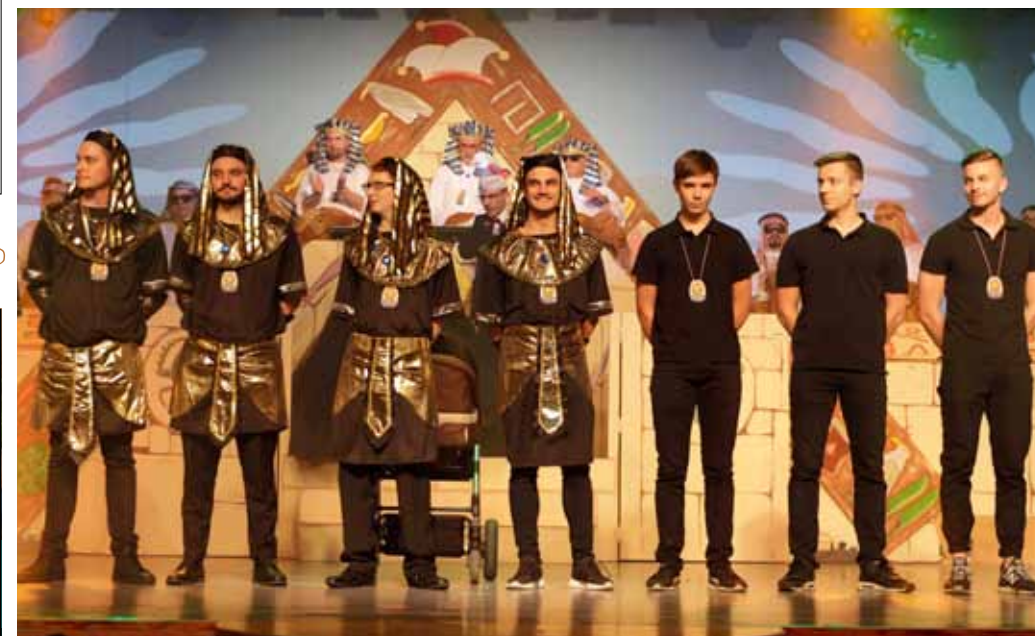
Jahresorden für den Jung-11er-Rat.