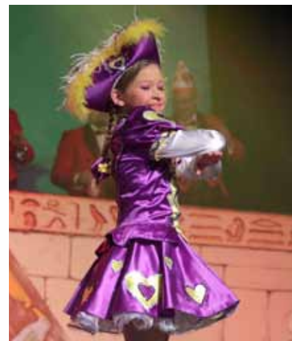
Das Tanzmariechen bei der 2019er-Kampagne.